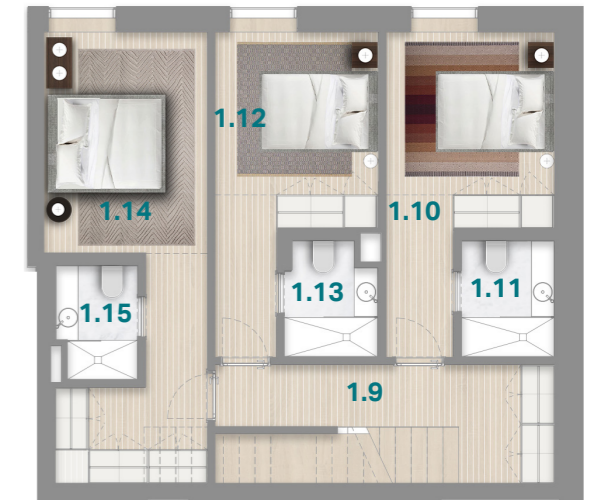
PISO 4 4 TH FLOOR

APARTAMENTO BP ENTRADA A APARTMENT ENTRANCE