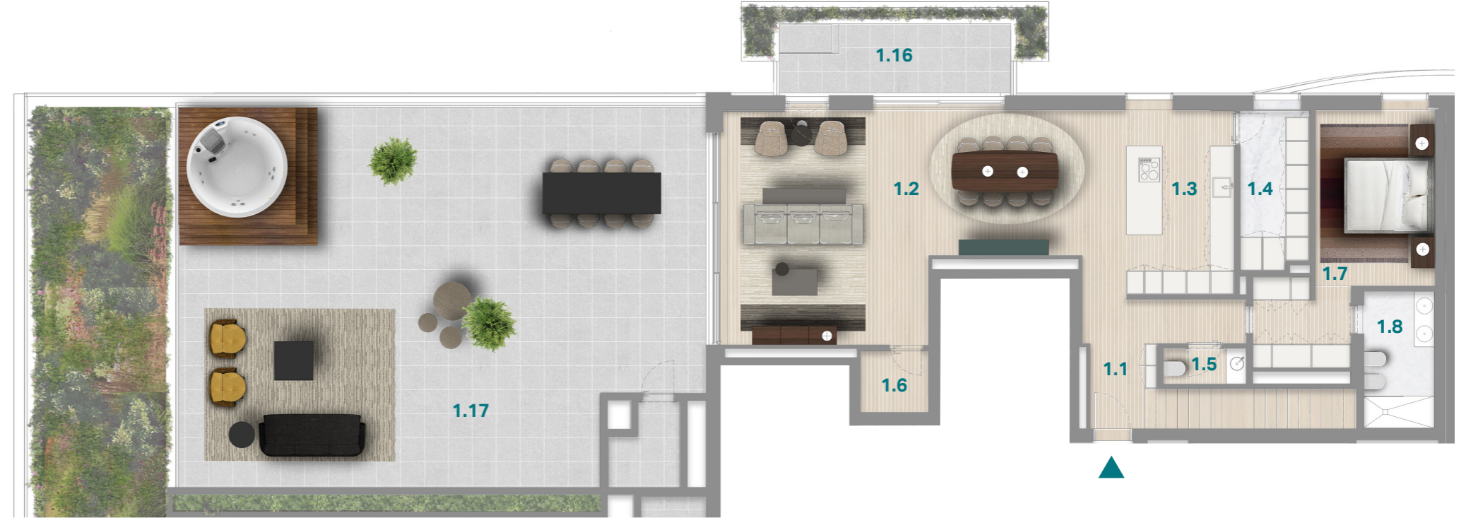
PISO 5 5 TH FLOOR