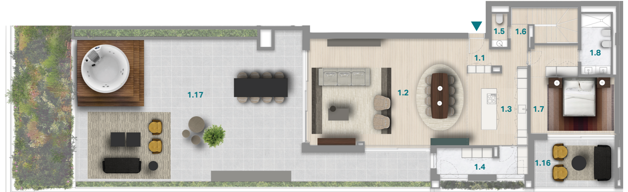
PISO 5 5 TH FLOOR